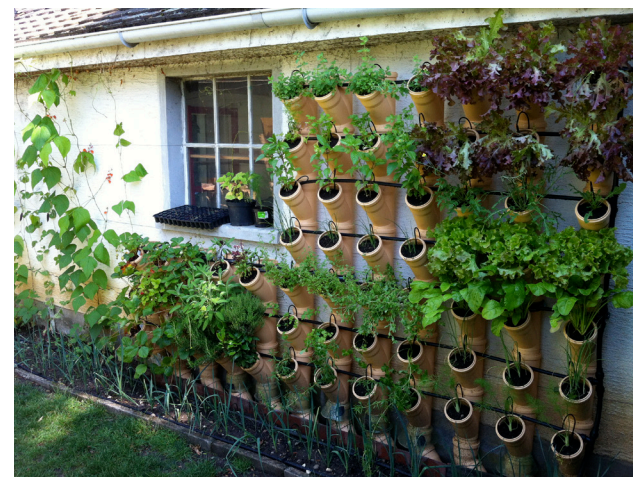
VG Garden™ façade, semé et irrigué avec de l'eau de pluie, 2013 Troinex (GE)