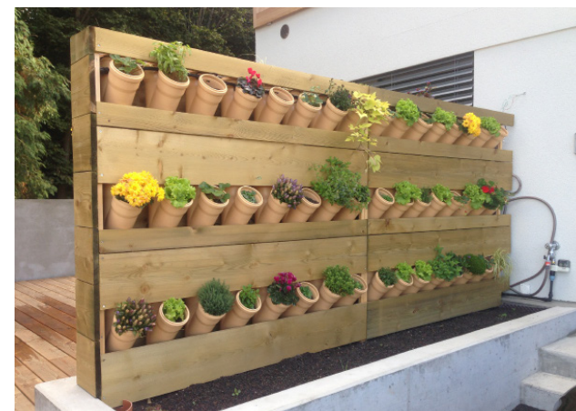
VG Garden™ séparateur (recto-verso végétalisé), planté et connecté à un robinet, 2013 Le Mont (VD)